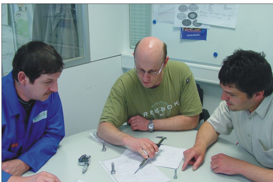
Tým Spojovacího Expressu firmy ARNOLD v akci

Časový faktor se v globalizované konkurenci stává rozhodujícím impulsem úspěchu. Výrobní a produktově zaměřené společnosti vyvíjejí nové možnosti nebo nově upravují hlavní směry svého konání tak, aby přišly s inovačními řešeními na trh rychleji než konkurence. Předpokladem je snížit náklady na vývoj a dobu jeho trvání.