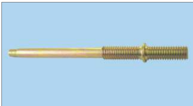
Trny se dvěma závity