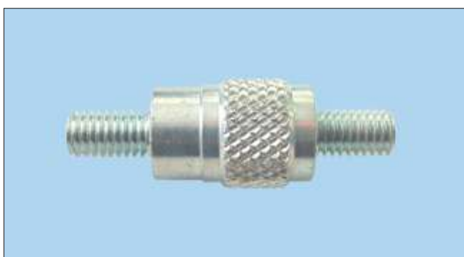
Trny se dvěma závity a rýhováním