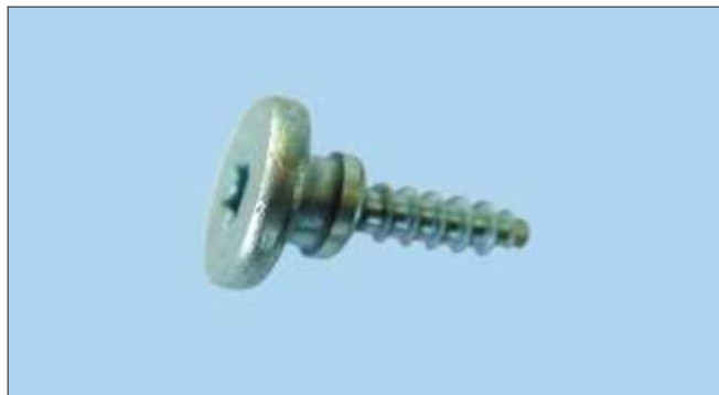
Spojovací šroub s drážkou